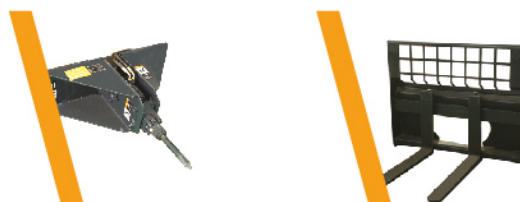
▼ Martillo Hidráulico ▼ Porta Pallets