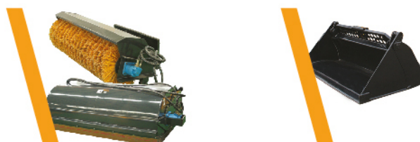
▼ Barredora con o sin cajón ▼ Balde 4 en 1