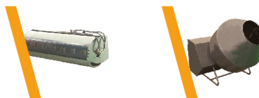
▼ Rodillo liso Vibratorio ▼ Mezcladora de Hormigón