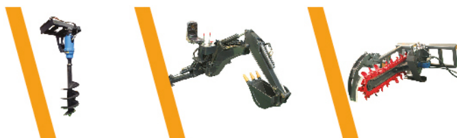
▼ Hoyadora ▼ Retroexcavadora ▼ Zanjeadora